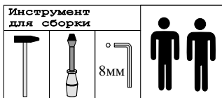
Схема сборки стеллажа N-64